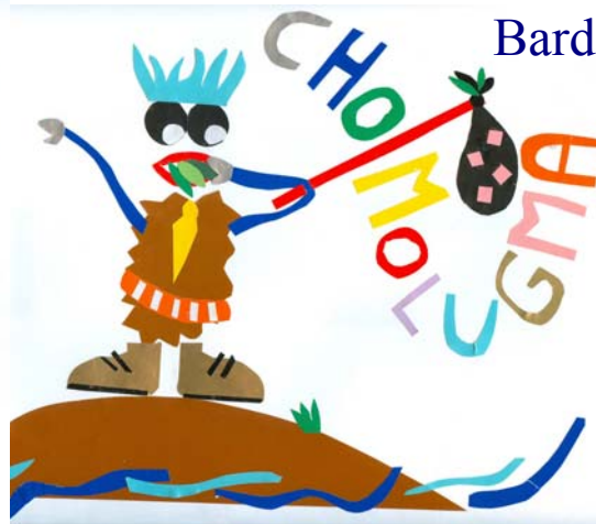
Chomolugma vive in un'isola, mangia foglie. Silvia Borello