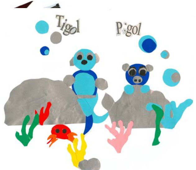
I due animaletti si chiamano Tigol e Pigol, vivono nelle acque tropicali, mangiano alghe, il loro miglior amico è un granchio da compagnia.