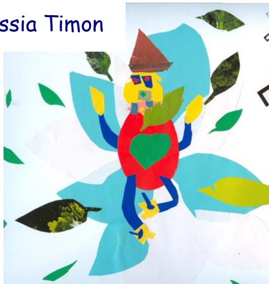
Petalì vive in una rosa azzurra e bianca, mangia polline.